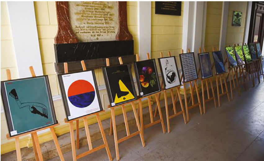
Abbildung 9. Plakatausstellung zum Thema „Naturschutz“, gestaltet von StudentInnen der Akademie der Bildenden Künste in Warschau.