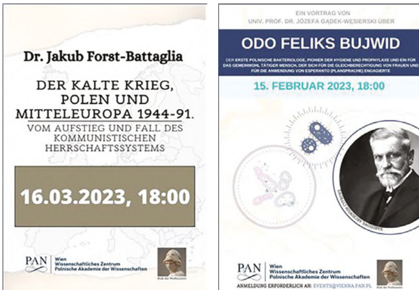
Abbildung 3 und 4: Einladungen zu zwei Vortragsabenden im Zentrum (Polnische Akademie der Wissenschaften in Wien – Wissenschaftliches Zentrum in Wien).