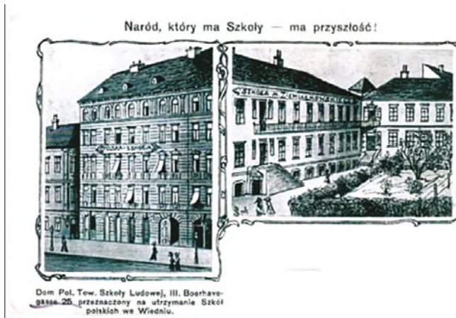
Abbildung 2. Historische Ansicht des Polnischen Hauses.

Erinnerungstafel an der Hausfassade des Zentrums in der Boerhaavegasse 25 (Polnische Akademie der Wissenschaften in Wien – Wissenschaftliches Zentrum in Wien).