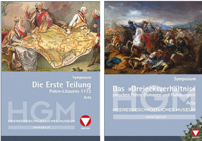
Abbildung 11 und 12: ACTA AUSTRO-POLONICA Bd. XIII & XIV.

nannt. Diese erscheinen seit dem Jahr 2009 und fassen die Erkenntnisse jener Konferenzen zusammen, die seit 2008 in Zusammenarbeit des Zentrums mit dem Heeresgeschichtlichen Museum in Wien organisiert werden. Im Rahmen dieses Konferenzzyklus referieren Jahr für Jahr namhafte Wissenschaftler in der Ruhmeshalle des Heeresgeschichtlichen Museums in Wien zu ausgewählten Aspekten unserer gemeinsamen österreichisch-polnischen Geschichte.