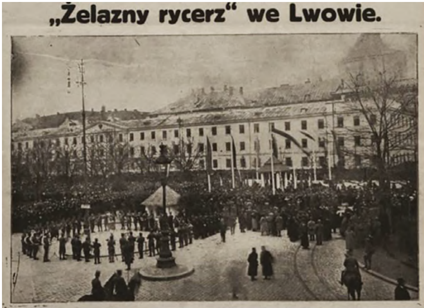
Abbildung 5. Feier anlässlich Enthüllung des „Lemberger Ritters“ in der Hauptallee der Stadt, „Wały Hetmańskie“ („Nowości Ilustrowane“, April 1916).

errichten. In erster Linie handelte es sich dabei um eindrucksvolle Kriegsgräberstätten in Galizien. Auf der Kaim-Anhöhe am Stadtrand von Krakau wurde ein riesiger Obelisk errichtet, um an die Zurückdrängung der Russen aus der Stadt im Dezember 1914 zu erinnern. 29