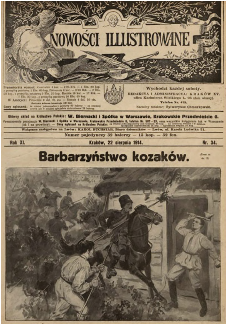
Abbildung 3. Die Kosaken als Brandstifter (Titelseite der „Nowości Ilustrowane“, 22. August 1914).