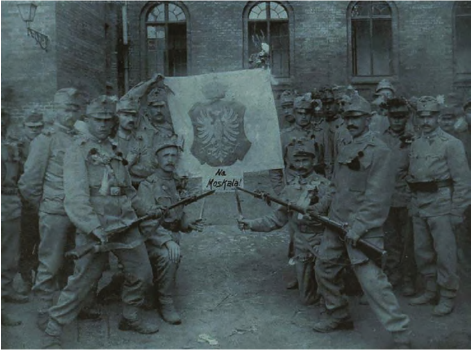
Abbildung 1. Die „Krakauer Kinder“ auf einem Foto von Anfang August 1914: Polnische nationale Symbolik und österreichische Uniformen („Nowości Ilustrowane“, 22. August 1914, S. 2).

In den „Nowości Ilustrowane“ wurden die modernen österreichischen Waffen gezeigt. Besonders beeindruckend sollten Fotos der berühmten schweren Skoda-Mörser und deren zerstörerische Auswirkungen. Auch den Krieg verharmlosende heitere Motive wurden publiziert. Eine Ausgabe der Zeitschrift zeigte tapfere Jungen, die ihren Vater ins Feld begleiteten, eine andere zeigte einen fröhlichen Soldaten im Lauf eines Mörser. In einer weiteren Reportage wurde ein „tapferer“ Eber aus Galizien vorgestellt, der die Kosaken verjagt. 20