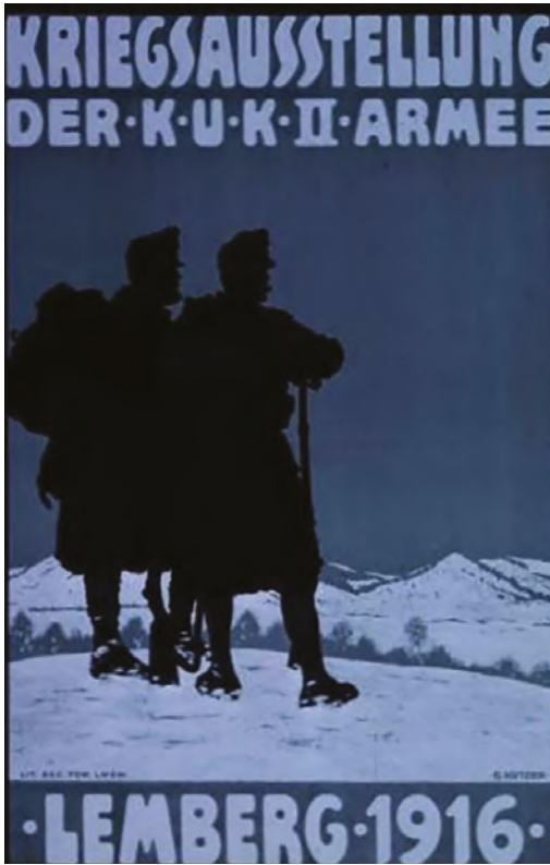
Abbildung 7. Plakat der Kriegsausstellung in Lemberg.

Schließlich wurden auch Straßennamen geändert. Auf diese Weise wurde in Lemberg Eduard Böhm-Ermolli geehrt, dessen Truppen die Stadt im Juni 1915 von der russischen Besatzung befreit hatten. Ein weiteres Propagandaelement war die Zurschaustellung erbeuteter Kriegsausrüstung, zum Beispiel im Lemberg. Weiters wurden Kunstausstellungen zu mit dem Krieg verbundenen Themen organisiert. Allerdings wurden solche Veranstaltungen in Galizien nicht in solch großem Umfang organisiert wie in Wien, Budapest, Salzburg oder Prag. Nichtsdestoweniger wurde im Herbst 1916 in Lemberg eine Ausstellung der 2. Armee eröffnet