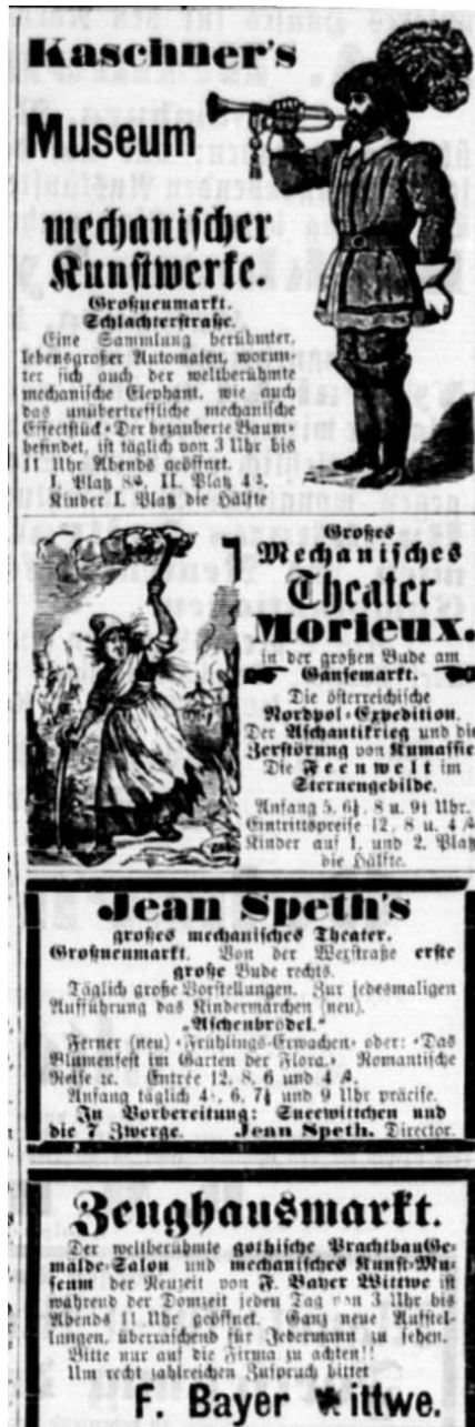
Abbildung 2. Werbeankündigungen für Vorführungen von Figuren und mechanischen Objekten. (Quelle: "Die Reform: ein Volksblatt", 23. Jänner 1875, S. 8).