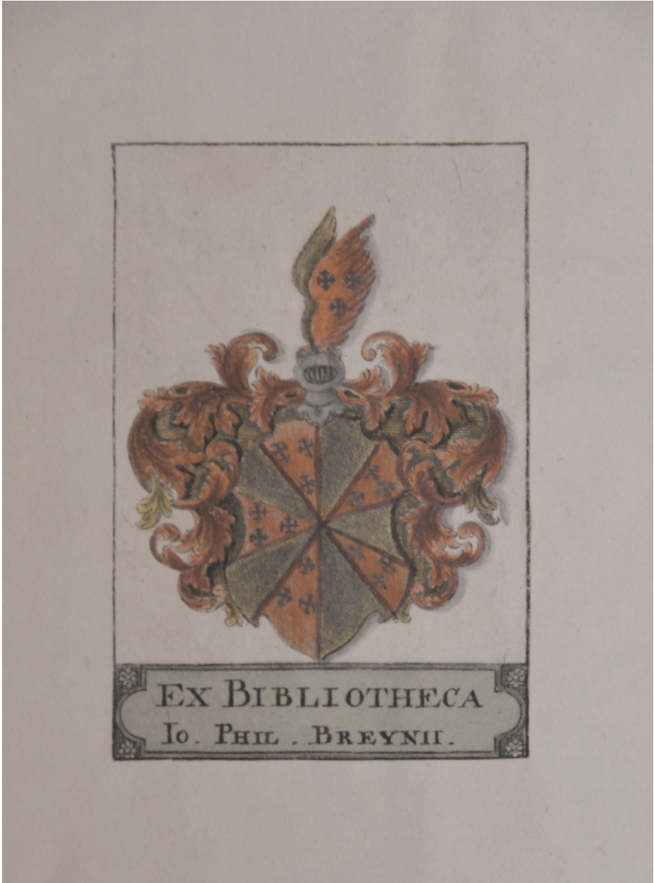
3. Barwny ekslibris herbowy Breynów wklejony na odwrociu pierwszej karty tomu Eleazar Albin, A natural history of spiders, and other curious insects , London: by John Tilly, 1736 Egzemplarz z księgozbioru Breynów, następnie w bibliotece Rosenbergów, potem w bibliotece Naturforschende Gesellschaft, obecnie w zbiorach Biblioteki Politechniki Gdańskiej, sygn. III 503027