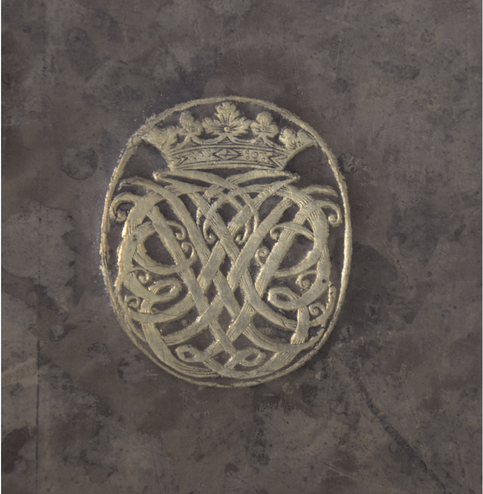
9. Superekslibris z inicjałami Breynów na okładzinie dolnej jednego z tomów Locupletissimi rerum naturalium thesauri... Alberta Seby

Albert Seba, Locupletissimi rerum naturalium thesauri accurata descriptio, et iconibus artificiosissimis expressio , Tomi 1-2, Amstelædami: apud Janssonio-Waesbergios [et al.], 1734-1735 [dwa tomy współprawne]