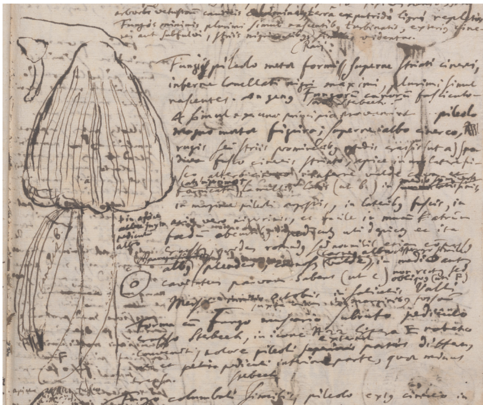
1. Fragment rękopisu Jacoba Breynę poświęconego grzybom Pomorza. W odręcznej notatce sporządzonej przez uczonego i opatrzonej schematycznym wyobrażeniem opisywanego naturalium pojawia się także bezpośrednie odwołanie do obiektu wyobrażonego na tablicy nr 22, lit. E, w pracy van Sterbeecka (il. 2)

Forschungsbibliothek Gotha: Nachlass Breynę, Chart. A 788, k. 78r