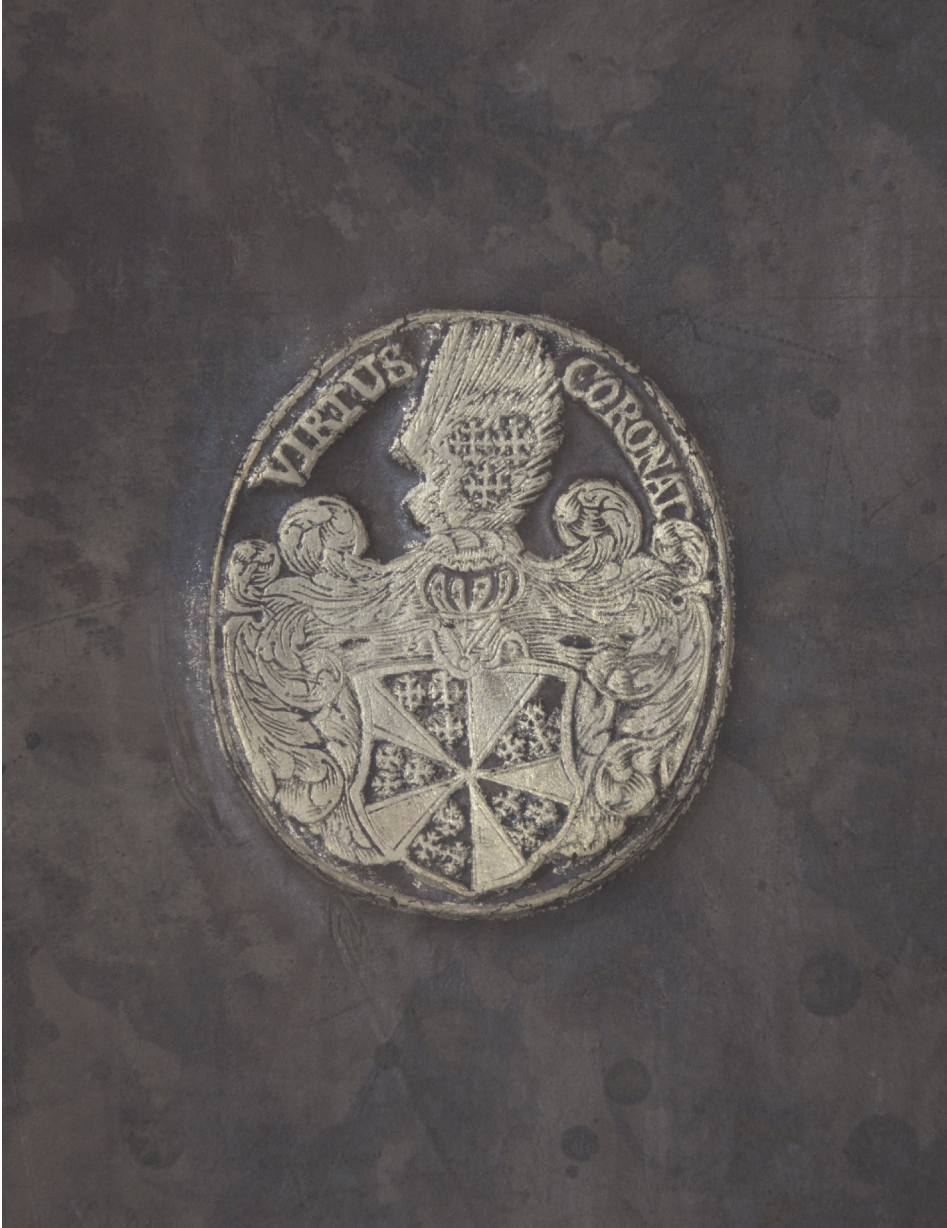
8. Superekslibris z herbem Breynów na okładzinie górnej jednego z tomów Locupletissimi rerum naturalium thesauri... Alberta Seby

Albert Seba, Locupletissimi rerum naturalium thesauri accurata descriptio, et iconibus artificiosissimis expressio , Tomi 1-2, Amstelaedami: apud Janssonio-Waesbergios [et al.], 1734-1735 [dwa tomy współprawne]