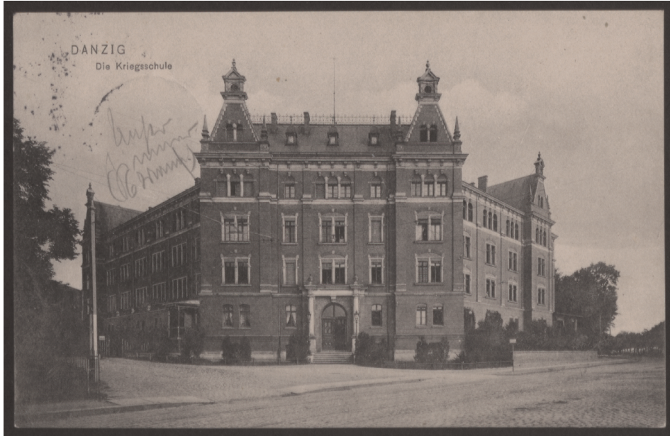
1. Gmach Szkoły Wojennej w Gdańsku na pocztówce z 1910 roku