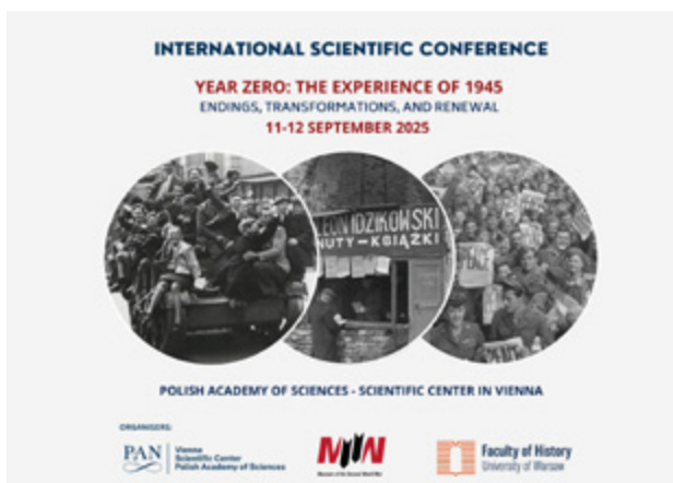
Abbildung 3. Konferenz „Year Zero: The Experience of 1945 – Endings, Transformations, and Renewal“

Diesem Interesse an Neuanfängen trug auch die Konferenz „Year Zero: The Experience of 1945 – Endings, Transformations, and Renewal“ Rechnung, die in unserem Zentrum von 11. bis 12. September 2025 stattfand. Ziel dieser Konferenz war es, bedeutende soziale, historische und kulturelle Veränderungen nach dem Ende des Zweiten Weltkriegs zu untersuchen, wobei ein Schwerpunkt auf den unterschiedlichen Erfahrungen in Europa nach 1945 lag. Diese Veranstaltung wurde in Kooperation mit der Fakultät für Geschichte der Universität Warschau und dem Museum des Zweiten Weltkriegs in Danzig organisiert.