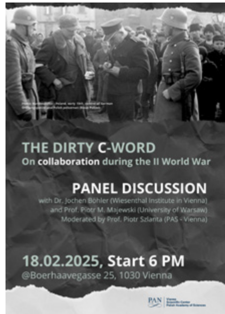
Abbildung 6. Podiumsdiskussion „The dirty C-word“. On collaboration during the Second World War“