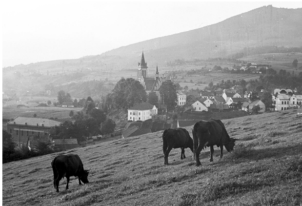
Abbildung 3. Mszana Dolna, Blick vom Gipfel des Grunwald

Flizaks Memoiren umfassen sechs Hauptteile, von denen jeder einem Abschnitt seines Lebens und seiner beruflichen Tätigkeit gewidmet ist. Die einzelnen Kapitel haben eigene Titel und eine Gliederung, die abhängig vom jeweiligen Umfang in mehrere Unterkapitel unterteilt ist. 23 Vorangestellt ist ein zweiseitiges Biogramm und eine Einleitung, die die Landschaft der Nordhänge des Gorcgebirges beschreibt.