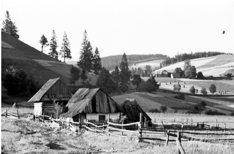
Abbildung 6. Goralengehöft bei Mszana Dolna