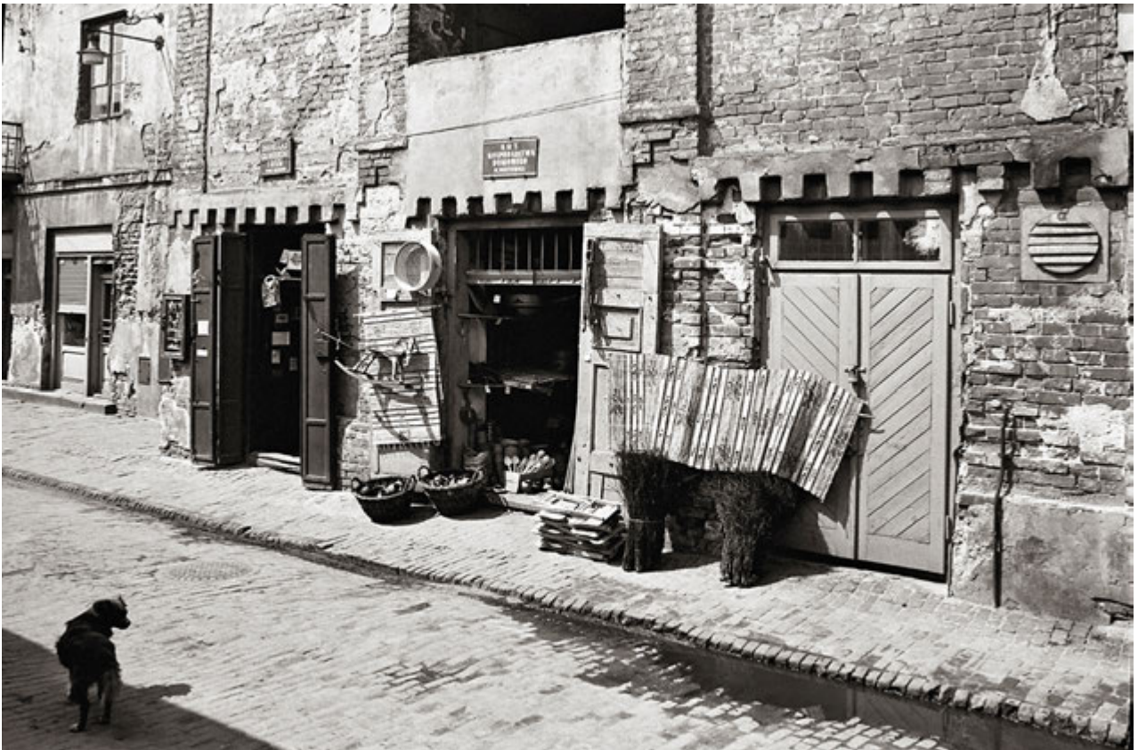
4. „Drobny handel” 1975, Autor S. Orłowski