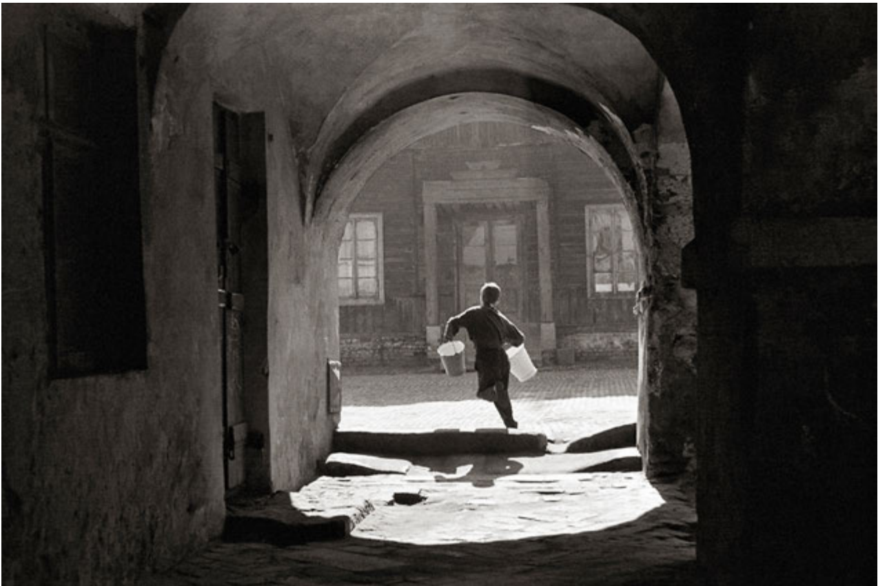
2. „Po wodę” 1964, Autor S. Orłowski

1. S. Orłowski. 1960. An interesting reading