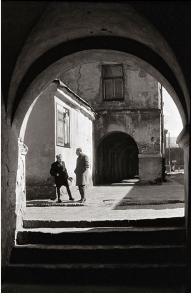
3. „Rozmowa” 1966 Autor S. Orłowski