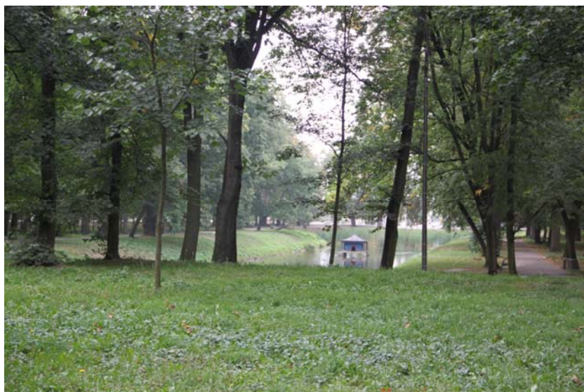
Ryc. 4. Kanał ogrodowy w Radzynie Podlaskim, stan na rok 2012