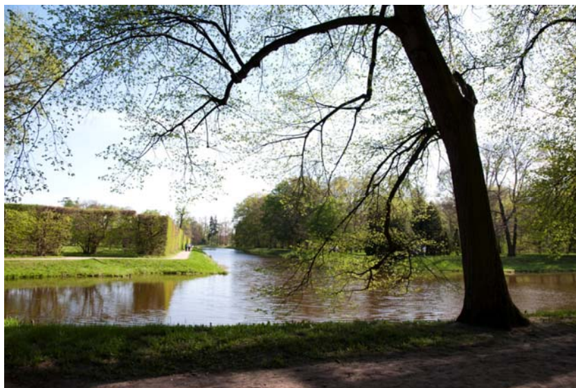
Ryc. 3. Kanał ogrodowy w Nieborowie, stan na rok 2012