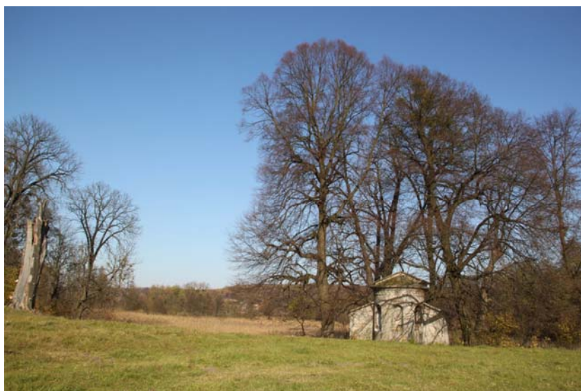
Ryc. 5. Widok na kaplicę grobową w Stryjowie, w tle zarośnięty staw ogrodowy, stan na rok 2010