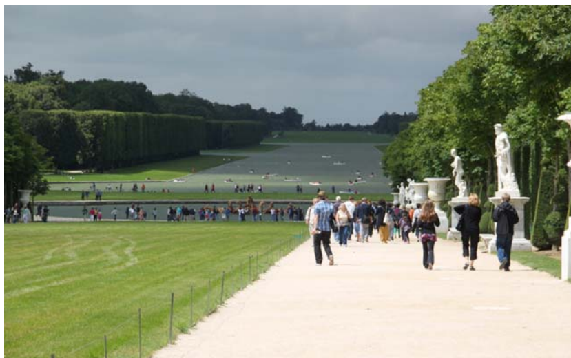
Ryc. 2. Kanał ogrodowy w Wersalu, stan na rok 2012, (fot. K. Boguszewska)

wie 10 , zaś litery Z założenie wodne w Białymstoku 11 . Często kanały łączone były z systemami basenów 12 .