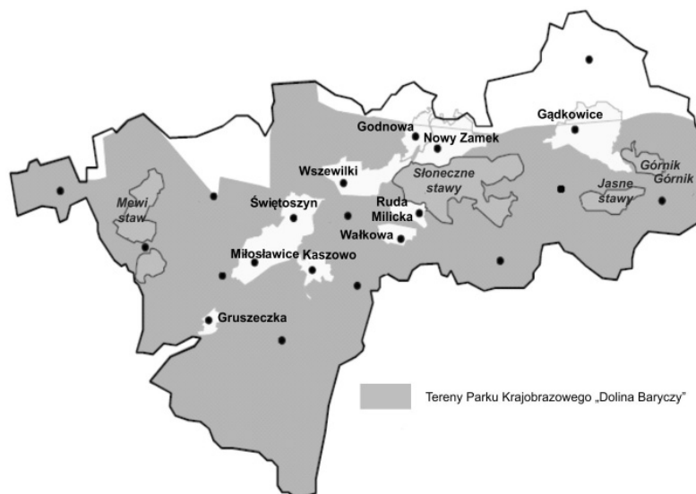
Ryc. 1. Położenie wybranych obrębów na tle zasięgu PK „Dolina Baryczy”