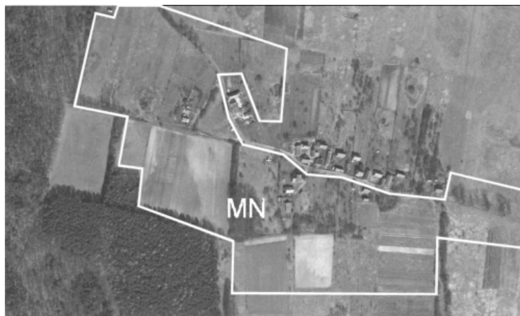
Ryc. 5. Tereny przeznaczone pod zabudowę według ustaleń planu miejscowego dla wsi Walkowa