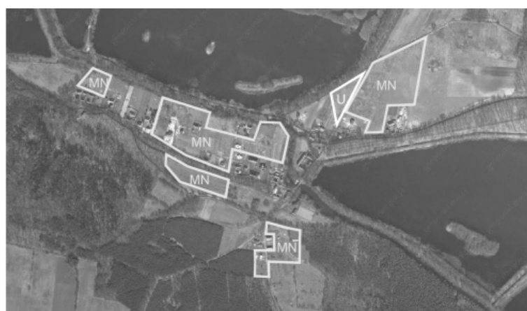
Ryc. 3. Tereny przeznaczone pod zabudowę według ustaleń planu miejscowego dla wsi Ruda Milicka

Trzykrotny wzrost powierzchni mieszkaniowej został zaplanowany w obrębie Wałkowa położonym na południowy-wschód od granicy miasta Milicz. Znaczna rozbudowa tego obrębu szczególnie negatywnie może wpłynąć na walory kompleksu leśnego, który był predysponowany do utworzenia rezerwatu leśno-florystycznego (ryc. 5).