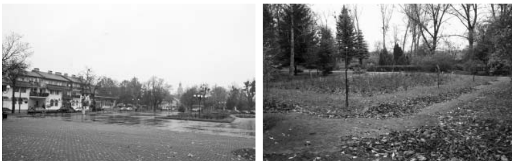
Fot. 3, 4. Plac Wolności i park Helwinga – zaniedbana przestrzeń publiczna przed przebudową