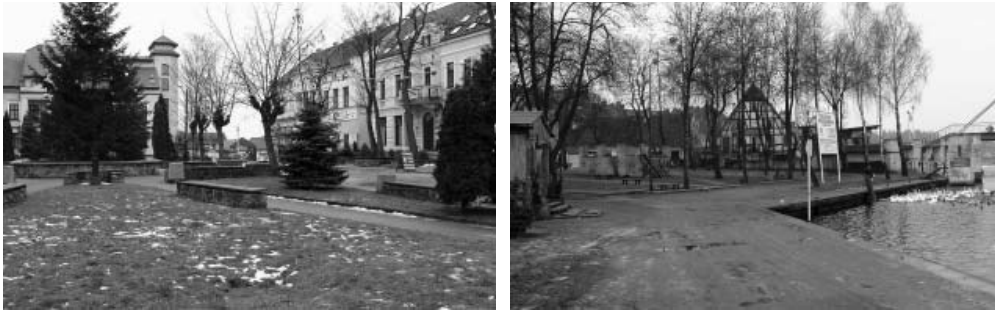
Fot. 1, 2. Plac Wolności i przystań Żeglugi Mazurskiej – najważniejsza przestrzeń publiczna