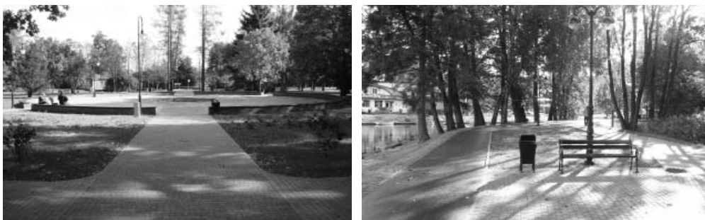
Fot. 7, 8. Efekty przebudowy fragmentów przestrzeni publicznej w Węgorzewie: Park Helwina i pasaż nad kanałem

nadejście czas na radykalną przebudowę Placu Wolności, ale w przeciwieństwie do inwestycji realizowanych przez Mikołajki władze Węgorzewa będą musiały przeprowadzić główne zmiany w ścisłej współpracy z inwestorami prywatnymi, gdyż część dotychczasowej powierzchni rozległego placu zostanie przeznaczona do sprzedaży.