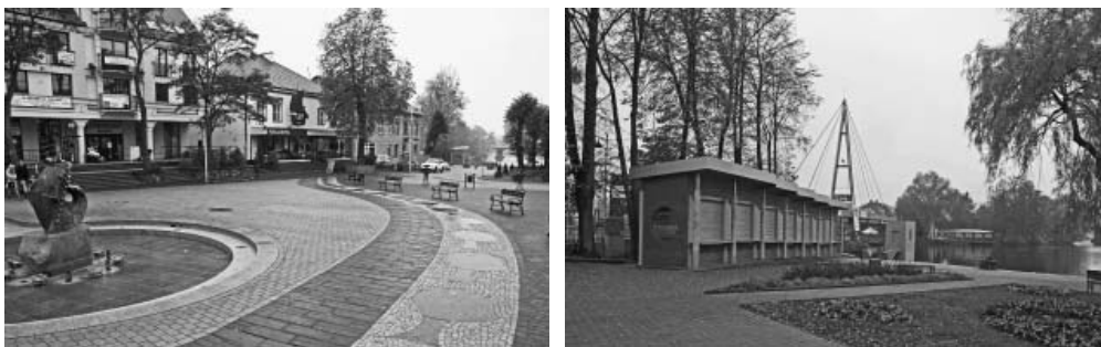
Fot. 5, 6. Efekty przebudowy przestrzeni publicznej w Mikołajkach: Plac Wolności i przystań Żeglugi Mazurskiej

Węgorzewo to odmienny sposób postępowania, w którym przebudowa przestrzeni publicznych została rozpoczęta nie od głównego placu miejskiego, a od terenów otaczających, takich jak Park Helwinga i pasaż nad kanałem (fot. 7,8). W następnych latach