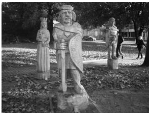
Fot. 6. Drewniane rzeźby królów polskich