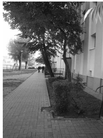
Fot. 9. Osiedle przy ul. Kaliskiej

Proces przemian jest zbyt powolny, aby udało się wszystko osiągnąć w ciągu zaledwie 10 lat, gdyż degradacja historycznego centrum trwała kilkadziesiąt lat, zatem zaniedbania są bardzo duże. Jednak dzięki dotychczasowym przekształceniom przestrzeni publicznej, centrum Łęczycy jest nie tylko przyjazne dla ludności lokalnej, ale możliwe stało się również zwiększenie zainteresowania turystów tym miastem, które jest jednym z niewielu w Polsce Środkowej o zachowanym średniowiecznym planie zabudowy i dość licznych, zachowanych obiektach zabytkowych o randze regionalnej i ponadregionalnej. Wzmożenie ruchu turystycznego ma wspomóc zlokalizowane w ratuszu Centrum informacji turystycznej, którego do tej pory nie było. Należy również zaznaczyć, że Stare Miasto w Łęczycy otrzymało nagrodę w konkursie TUP w 2009 r. za najlepiej zrewitalizowaną miejską przestrzeń publiczną. Udało się stworzyć dość zwartą, atrakcyjną przestrzeń publiczną dzięki odnowieniu nawierzchni rynku oraz ulic i chodników w najstarszej, średniowiecznej części miasta, gdzie odnowiono także blisko 40 kamieniczek. Przyciągnęło to nowe usługi i sklepy, a poszerzona oferta handlowo-usługowa ożywiła centrum miasta. Zrewaloryzowanie XIX-wiecznego parku w bezpośrednim sąsiedztwie Starego Miasta, a także uporządkowanie terenu wokół zamku, stworzyło zwarty obszar atrakcyjnej przestrzeni publicznej 1 .