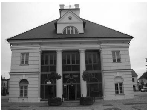
Fot. 8. Wyremontowany budynek ratusza

Wskutek dotychczasowych przemian, związanych z realizacją Programu Rewitalizacji Łęczyckiej Starówki , ponownie pełni ona funkcję centrum administracyjnego. Do ratusza powrócił Urząd Miasta – Delegatura Spraw Obywatelskich (fot. 8). Ponadto, Starostwo wynajmuje od miasta budynek, znajdujący się przy głównym placu miasta.