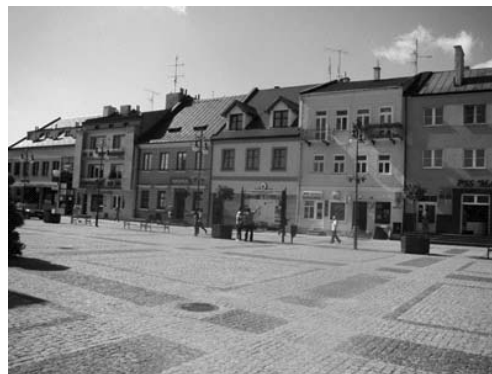
Fot. 2. Wymieniona nawierzchnia Placu T. Kościuszki

W ramach Programu Rewitalizacji wyremontowano część kamienic.