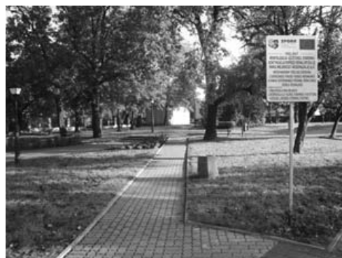
Fot. 7. Skwer łączący Stare Miasto i Al. Jana Pawła II