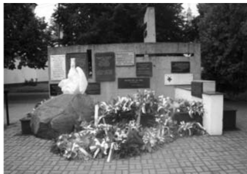
Fot. 1. Pomnik ku czci Bohaterów Bitwy nad Bzurą w 1939 r., na głównym placu miasta

Wszystkie te działania dążyły do nadania Placowi T. Kościuszki funkcji reprezentacyjnych, jako wizytówki Łęczycy w związku ze stale wzrastającym ruchem turystycznym, skupionym wokół odbudowanego zamku. W latach 70. w rynku działały dwie restauracje, obsługujące przybywających gości. Natomiast pod koniec lat 80. funkcjonowa-