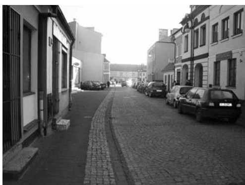
Fot. 4. Przebudowana nawierzchnia ul. Kaliskiej

Powrócono do historycznej, kamiennej nawierzchni (fot. 4). Wprowadzono również miejsca parkingowe uwzględniając zasadę, w myśl której dojazd na obszar starówki jest możliwy, lecz utrudniony ( Program... 2004).