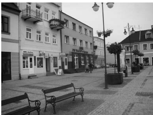
Fot. 3. Zachodnia część Placu T. Kościuszki

Poprawiono warunki mieszkaniowe przez wyposażenie budynków w pionory sanitarne oraz wymianę ogrzewania z węglowego na gazowe, co przyczyniło się do poprawy stanu środowiska. Z danych uzyskanych w Referacie Finansowym wynika, że wykonano termomodernizację 37 budynków, zlokalizowanych w okolicy rynku. Na ten cel przeznaczono 8 135 733,03 zł. Projekt był współfinansowany z Ekofunduszu oraz pożyczki z Wojewódzkiego Funduszu Ochrony Środowiska i Gospodarki Wodnej.