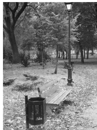
Fot. 5. Park Miejski w Łęczycy – elementy małej architektury

Ponadto, aby zachować spójność obszaru urządzono skwer, łączący Al. Jana Pawła II ze Starówką, gdzie do 1940 r. znajdowała się synagoga żydowska, zniszczona przez hitlerowców. Wprowadzono tam elementy małej architektury w postaci ozdobnych latarni, ławek oraz koszy na śmieci (fot. 7).