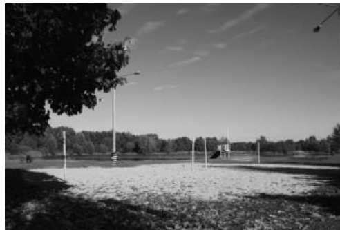
Fot. 4. Zalew

bione miejsce (fot. 1), Plac Dąbrowskiego z Kolegiatą (fot. 2) – w opiniach mieszkańców najładniejszy, ale nie ulubiony i mało bezpieczny, czyli obok funkcji sakralnej stanowiący wizytówkę miasta, ale nie służący w większym stopniu realizacji codziennych potrzeb mieszkańców. Kolejnymi lokalizacjami publicznych przestrzeni są park (fot. 3) i zalew (fot. 4) szczególnie ulubione przez mieszkańców i oceniane ogólnie, jako ładne. Dodatkowego komentarza wymagają opinie dotyczące parku. Mimo że miejsce jest ulubione, to jednak przeważają opinie negatywne dotyczące jego brzydoty, brudu i ograniczonego poczucia bezpieczeństwa odwiedzających go.