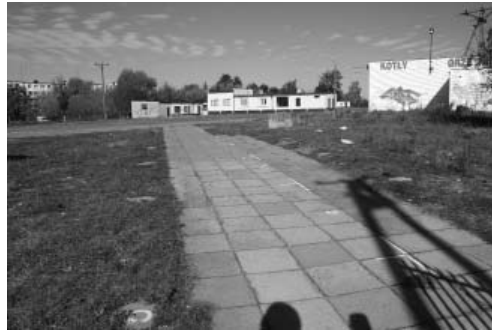
Fot. 8. Targowisko miejskie

Faktycznie, dla obserwatora z zewnątrz ten obszar miasta wymaga poprawy jego stanu (trudny dostęp, brak informacji o lokalizacji dla przyjezdnych, stan zaniedbania). Wydaje się, że właśnie ten obszar ze względu na liczbę opinii mieszkańców miasta powinien podlegać pilnym przemianom jakościowym. Liczba wskazań i oceny Kolumny Las (fot. 5 i 6) wskazują, że dla części mieszkańców Łasku właśnie ten obszar pełni funkcje rekreacyjnych przestrzeni publicznych, jednak znaczne oddalenie od centrum miasta wymaga przemieszczania się samochodem do tego miejsca. Uwagę zwracają przestrzenie publiczne osiedli mieszkaniowych odgrywające rolę codziennych spotkań mieszkańców miasta. W ich ocenach zwraca uwagę wysoki poziom ocen, jako bezpiecznych miejsc i ogólnie postrzeganych z przewagą pozytywnych ocen z wyjątkiem osiedla Batorego, na którym zlokalizowane jest targowisko.