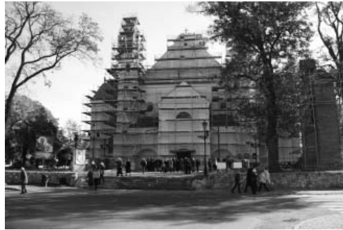
Fot. 2 .Plac Dąbrowskiego z Kolegiatą