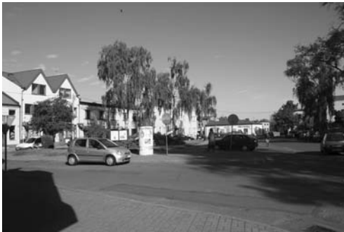
Fot. 1. Rynek w centrum Łasku