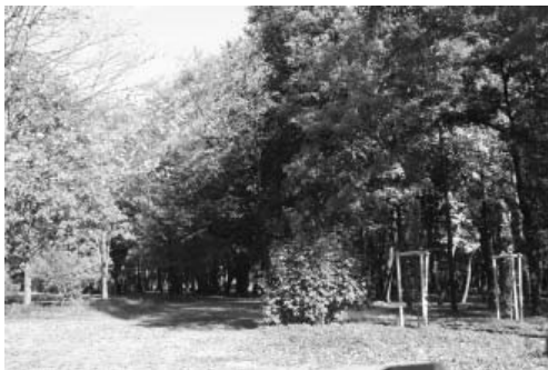
Fot. 3. Park