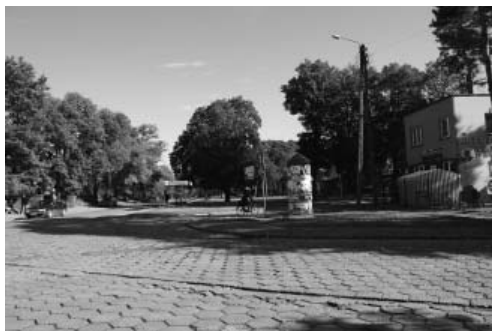
Fot. 5, 6. Kolumna Las