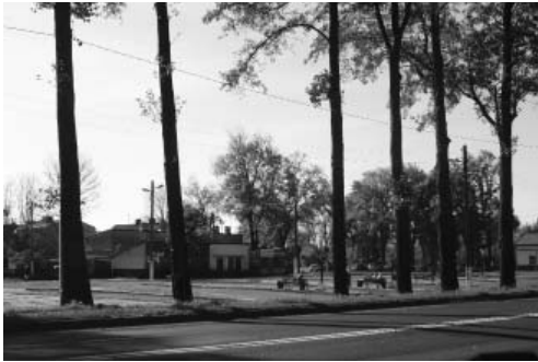
Fot. 7. Dworzec PKS