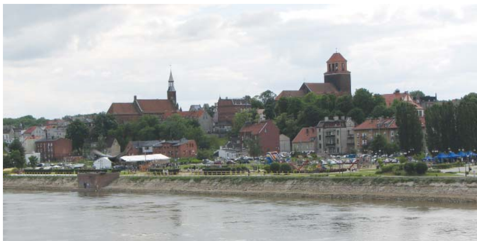
Fot. 3. Panorama Starego Miasta w Tczewie z Bulwarem Nadwiślańskim na pierwszym planie

W połowie lat 90. lokalne władze podjęły działania na rzecz podniesienia atrakcyjności centrum, a zarazem przesunięcia ciężenia układu funkcjonalnego miasta w stronę Wisły. Celem pierwszych prac była poprawa stanu technicznego i podniesienie bezpieczeństwa przestrzeni publicznych – przede wszystkim ulic [Gołędzinowska 2010].