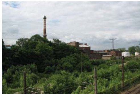
Fot. 5. Wyłączona z produkcji cukrownia w Pruszczu Gdańskim