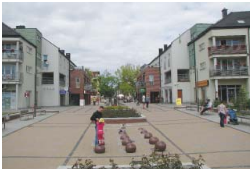
Fot. 4. Aleja ks. Wałęga – nowe centrum Pruszcza Gdańskiego

Nowym projektem realizowanym w Pruszczu Gdańskim, którego sama formuła niesie ze sobą silny wątek wizerunkowy, jest projekt stworzenia społecznej koncepcji zagospodarowania przestrzennego terenów dawnej cukrowni „Strefa Cukru”. Przedmiotem projektu jest obszar o powierzchni 20 ha wraz z zabytkowymi zabudowaniami cukrowni (fot. 5). Zespół położony w centralnej części miasta został wyłączony z produkcji w 2004 r. [www.strefacukru.pl 2012]. Początkowo władze miasta zakładały adaptację zespołu na funkcje usługowe, jednak w miarę trudności z pozyskaniem inwestora zdecydowano się na zmianę przeznaczenia terenu na obszary mieszkaniowe, co jednak również nie przyniosło oczekiwanych rezultatów. Miasto nie jest właścicielem terenu co z założenia ogranicza możliwość lokalizacji usług