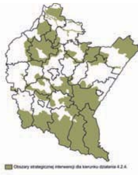
Ryc. 8. Obszar strategicznej interwencji dla kierunku 4.2.4.(ochrona bioróżnorodności)