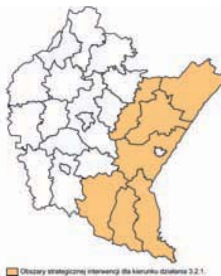
Ryc. 6. Obszar strategicznej interwencji dla kierunku 3.2.1. (Internet)