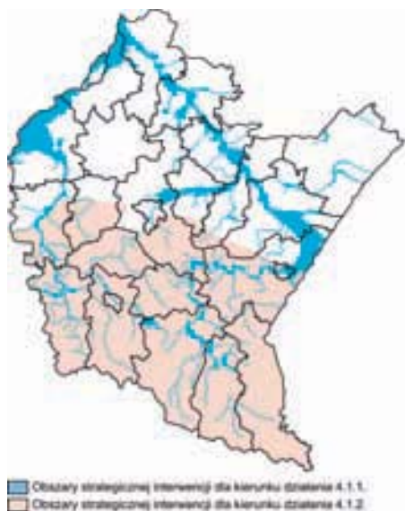
Ryc. 7. Obszar strategicznej interwencji dla kierunków: 4.1.1. (zagrożenie powodziowe) i 4.1.2. (zagrożenie osuwiskami)