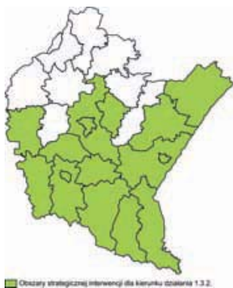
Ryc. 5. Obszar strategicznej interwencji dla kierunku 1.3.2. (turystyka)

W Strategii rozwoju województwa – Podkarpackie 2020 zdelimitowano 18 OSI, nie obejmujących całego województwa. Wybrane tego typu obszary strategicznej interwencji wobec obszarów wiejskich albo wobec części regionu, w tym obszarów wiejskich prezentują ryc. 5-9.