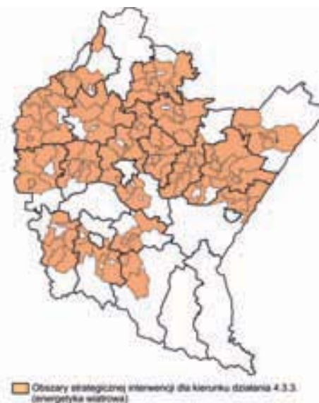
Ryc. 9, 10. Obszar strategicznej interwencji dla kierunku 4.3.3.