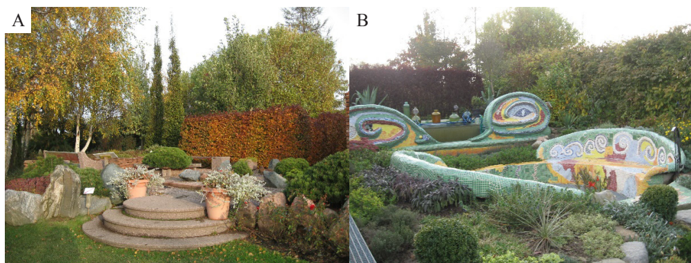
Fot. 2. Ogród Hortulus. A) Zakątek Ogień i Purpura B) Zakątek w stylu Gaudiego

Ogrody Hortulus (fot. 2) zostały zaprojektowane na obszarze blisko 5 ha. W ogrodach tych wykonano 28 zaułków tematycznych, które można podzielić na ogrody klasyczne (np. francuski, angielski), ogrody naturalistyczne (np. leśny, wrzosowisko, wodny, skalny), ogrody zmysłu (np. dźwięku, zapachu, kolorów), ogród japoński i ścieżkę głazów. Na uwagę zasługuje ogród w stylu Gaudiego (fot. 2B). W całym ogrodzie rośnie ponad 6 tys. gatunków i odmian, w tym egzotyczne i unikalne.