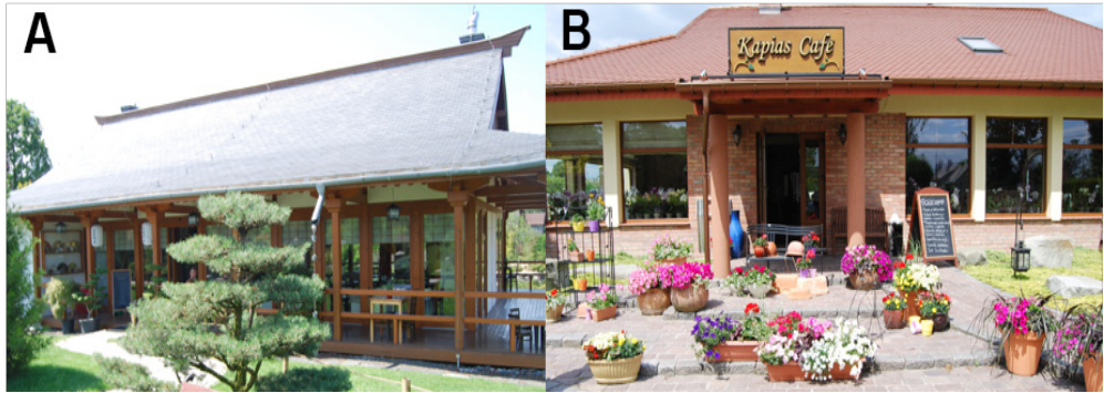
Fot. 4. A) Herbaciarnia Satoni w Piszczowicach, B) Restauracja-Cafe Kapias w Goczałkowicach

Lokalizacja obiektów gastronomicznych na terenie ogrodów pokazowych umożliwia wypoczynek również poza sezonem wegetacji roślin (tab. 3). Łączenie pobytu w ogrodach pokazowych i degustacji serwowanych posiłków całoroczne przez cały rok jest możliwe przede wszystkim w ogrodach japońskich w Piszczowicach.