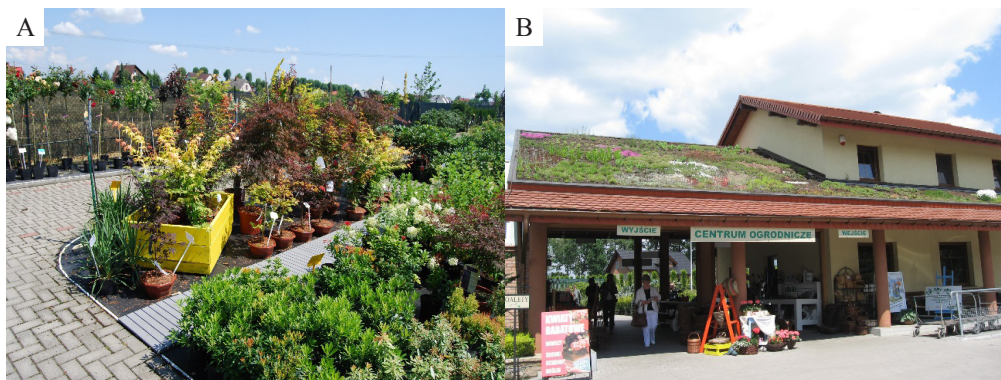
Fot. 3. Aranżacja obiektów handlowych A) dekoracyjne skrzynie wśród eksponowanych sadzonek w Ogrodzie Japońskim Pudełko B) żywy dach centrum ogrodniczego w Ogrodach Kapias

dysponuje elementami wzbogacającymi produkt turystyczny [Kaczmarek et al. 2002, s. 45; Mazurek, Kasperska 2014, s. 116; Seweryn 2005, s. 75]. Jak wynika z danych zamieszczonych w tab. 2 na terenie znacznej liczby ogrodów znajdują się obiekty handlowe i gastronomiczne, place zabaw i inne atrakcje. W Ogrodach pokazowych Kapias w Goczałkowicach i Ogrodach Hortulus w Dobrzycy funkcjonują duże Centra Ogrodnicze z bogatą ofertą materiału szkółkarskiego pochodzącego z własnych szkółek, nawozów, środków ochrony roślin, drobnego sprzętu ogrodniczego i dekoracji ogrodowych. Przy innych ogrodach działają niewielkie punkty sprzedaży materiału szkółkarskiego i sztukaterii ogrodowej. Właściciele sklepów zadbali o ich niebanalny wystrój, co sprawia że punkty handlowe stają się swoistymi ogrodami pokazowymi (fot. 3).