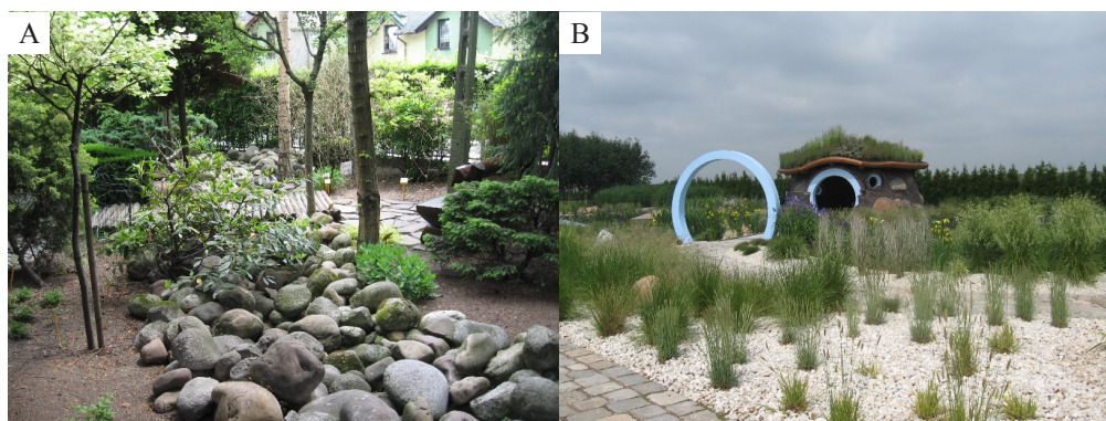
Fot. 1. Ogród Kapias. A) Sucha rzeka w Starym Ogródzie, B) Nowy Ogród z domkiem „Smerfów” z roślinnością na dachu.

Ogrody Kapias prezentują bogatą ofertę roślinności ozdobnej na terenie dwóch ogrodów modelowych: Starego i Nowego. Ogród Stary składa się z licznych zaułków i zakątków tematycznych (zaułek: holenderki, romantyczny, z fontanną, z hostami) wzbogaconych małą architekturą (altana z bluszczem, z drzew, kryta strzechą). Na uwagę zasługuje sucha rzeka (fot. 1A). Nowy ogród składa się z kilkunastu ogrodów tematycznych (fot. 1B), tj. Wiejski, Zachodzącego słońca, Nad stawem, Wrzosowisko, Czysta, Zima, Staw z altaną, Wąwóz wiosna. Na terenie tego ogrodu znajdują się usypane wzniesienia z tarasami widokowymi. Pod najwyższym punktem widokowym biegnie tunel, w którym ustawiono ławki (miejsce do wypoczynku w upalne dni). Ważne miejsce w ogrodzie zajmuje staw z drewnianą altaną. Budowa ogrodu nie jest jeszcze zakończona, bowiem nieustannie planuje się nowe aranżacje.