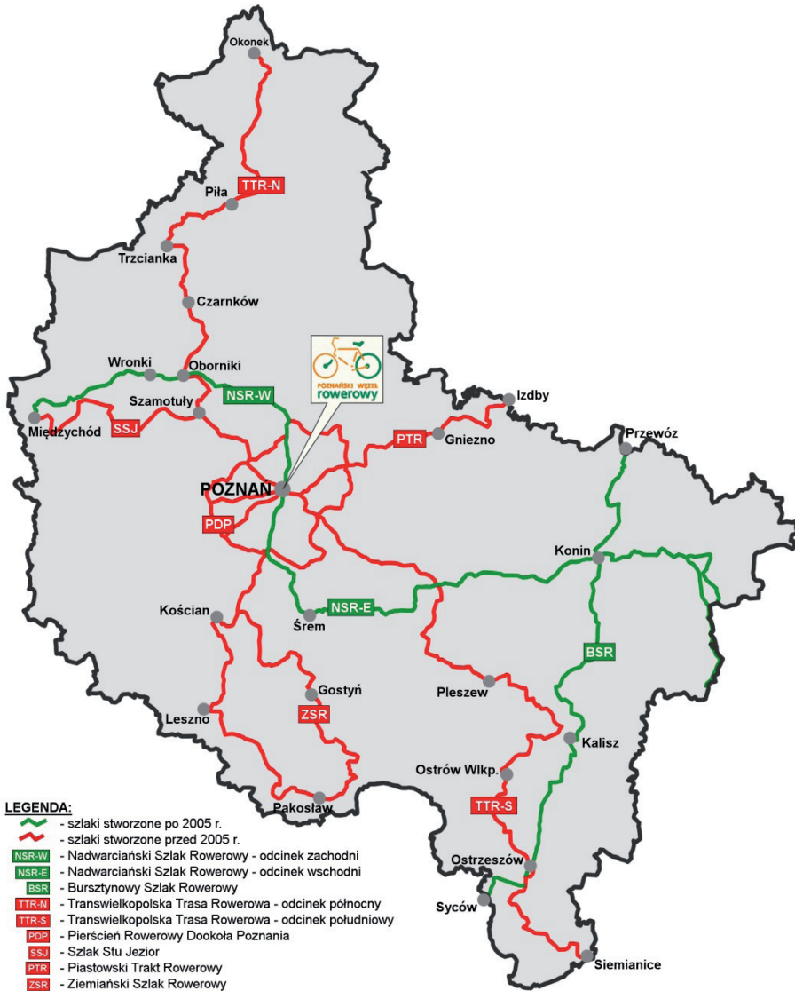
Ryc. 2. Schemat Wielkopolskiego Systemu Szlaków Rowerowych

Pierścień Dookoła Poznania jest najbardziej popularną trasą rowerową wśród cyklistów. Jego oryginalna struktura w formie koła z siedmioma szprychami, daje możliwość zaplanowania kilkunastu niezbyt długich wycieczek zaczynających się i kończących w stolicy Wielkopolski.