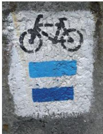
Fot. 3. Błędne oznakowanie szlaku rowerowego w gminie Sieraków

Poważnym utrudnieniem dla uprawiania turystyki rowerowej w woj. wielkopolskim jest jakość połączeń kolejowych. Dla wielu użytkowników rowerów dalsze wycieczki są możliwe w sytuacji, gdy część podróży odbywa się pociągiem (np. dojazd do miejscowości, gdzie rozpoczyna się szlak) lub gdy kolej daje poczucie bezpieczeństwa (możliwość powrotu w sytuacji awarii lub nagłego załamania pogody). Na przeszkodzie stoi niedostosowany tabor, ale też niewielka liczba kursów, zwłaszcza w dni wolne od pracy [Beim 2012].