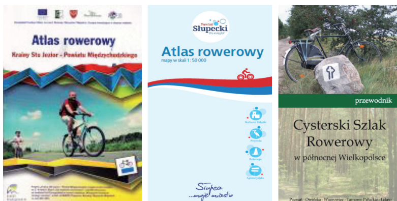
Fot. 1. Darmowe atlasy i przewodniki rowerowe