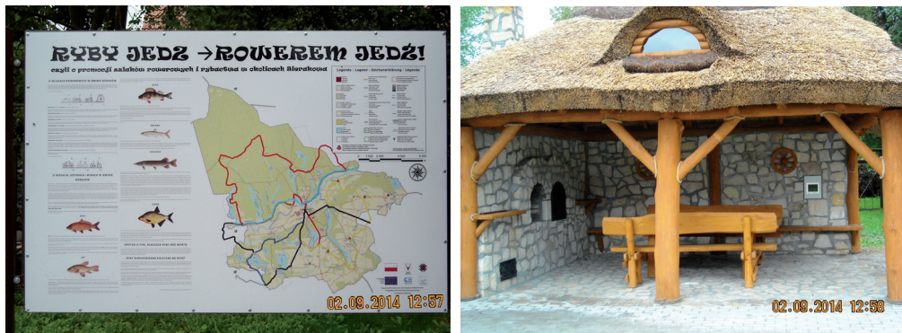
Fot. 2. Przystanek rowerowy z infokioskiem w Grobi (gmina Sieraków)